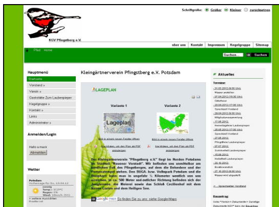
Unsere Homepage (Frontend)